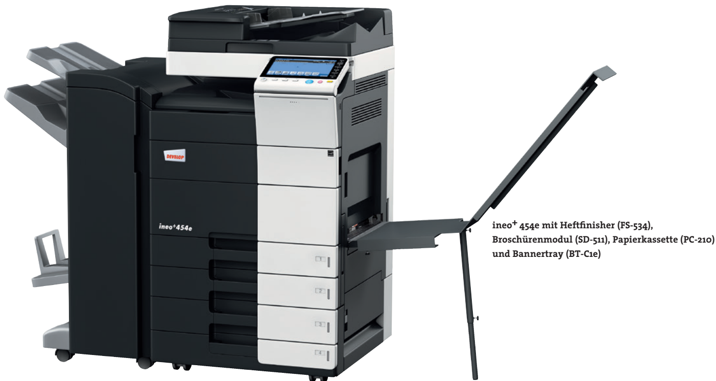
ineo+ 454e mit Heftfinisher (FS-534), Broschürenmodul (SD-511), Papierkassette (PC-210) und Bannertray (BT-C1e)