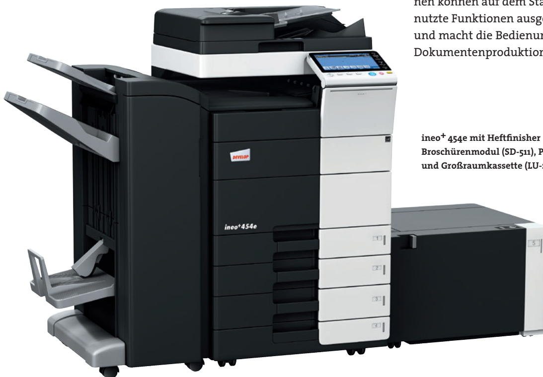
ineo + 454e mit Heftfinisher (FS-534), Broschürenmodul (SD-511), Papierkassette (PC-210) und Großraumkassette (LU-204)

Viele Multifunktionssysteme sind alles andere als anwenderfreundlich. Doch damit ist nun Schluss – die ineo + 454e ist für Ihre Anforderungen wie geschaffen. Das Bedienungskonzept ist intuitiv erfassbar und genauso leicht verständlich wie das eines Smartphones oder Tablet-PCs. Der kapazitive 9 Zoll-Touchscreen verfügt über vertraute Funktionen wie flick, drag&drop und pinch in&out, sodass die Bedienbarkeit ganz einfach ist. Und dank der neuen Menüstruktur lassen sich alle Funktionen auf einen Blick erfassen und die gewünschten Einstellungen mit nur wenigen Berührungen vornehmen. Ein weiterer Vorteil: Regelmäßig genutzte Funktionen können auf dem Startbildschirm abgelegt, ungenutzte Funktionen ausgeblendet werden. Das spart Zeit und macht die Bedienung kinderleicht. Einfacher ist Dokumentenproduktion noch nie gewesen!