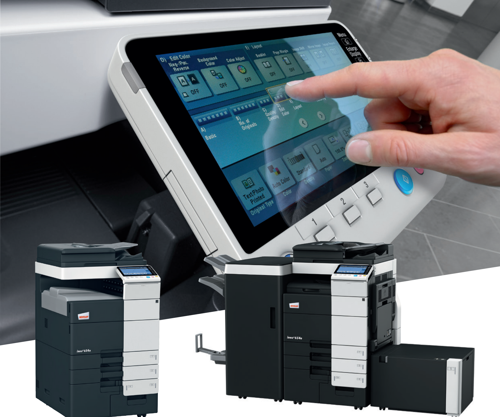
ineo+ 654e mit zusätzlicher Ausgabe Ablage (OT-503)