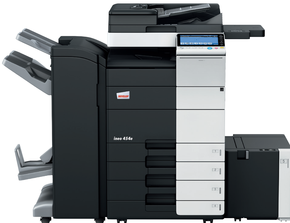
ineo 454e mit Heft- und Broschüren- finisher (FS-534SD), Papierkassette (PC-210), Großraumkassette (LU-301) und Ablagetisch (WT-506)

Jedes dieser Multifunktionssysteme – ineo 224e, ineo 284e, ineo 364e, ineo 454e und ineo 554e – ist einfach zu bedienen und hat eine große Bandbreite zusätzlicher Funktionen, die die tägliche Arbeit im Büro entscheidend erleichtern. Wenn beim Drucken, Kopieren und Scannen Zeit gespart wird, bleibt mehr Zeit für die eigentlichen Kernaufgaben – und das steigert die Produktivität im Büro.