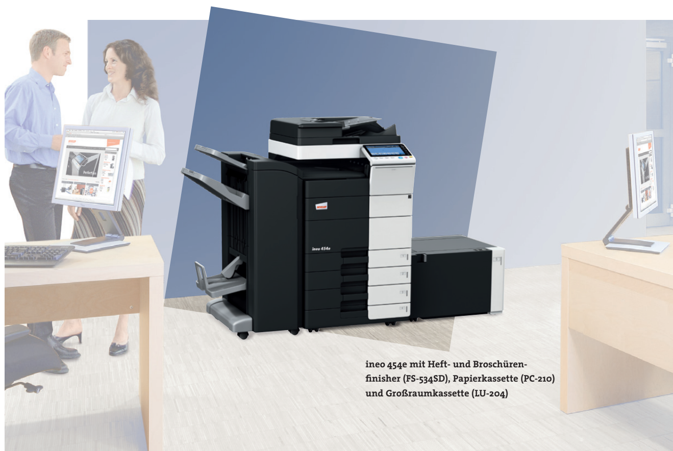
ineo 454e mit Heft- und Broschürenfinisher (FS-534SD), Papierkassette (PC-210) und Großraumkassette (LU-204)

Zahlreiche Energiesparmaßnahmen sorgen bei den ineo Schwarzweißsystemen dafür, dass der Energieverbrauch um bis zu 40 Prozent unter denen der Vorgängermodelle liegt. Das spart zum einen Geld, hilft aber auch der Umwelt. Die neue ineo e-Serie ist nicht nur gut für das Unternehmen, sondern verbessert auch dessen ökologischen Fußabdruck.