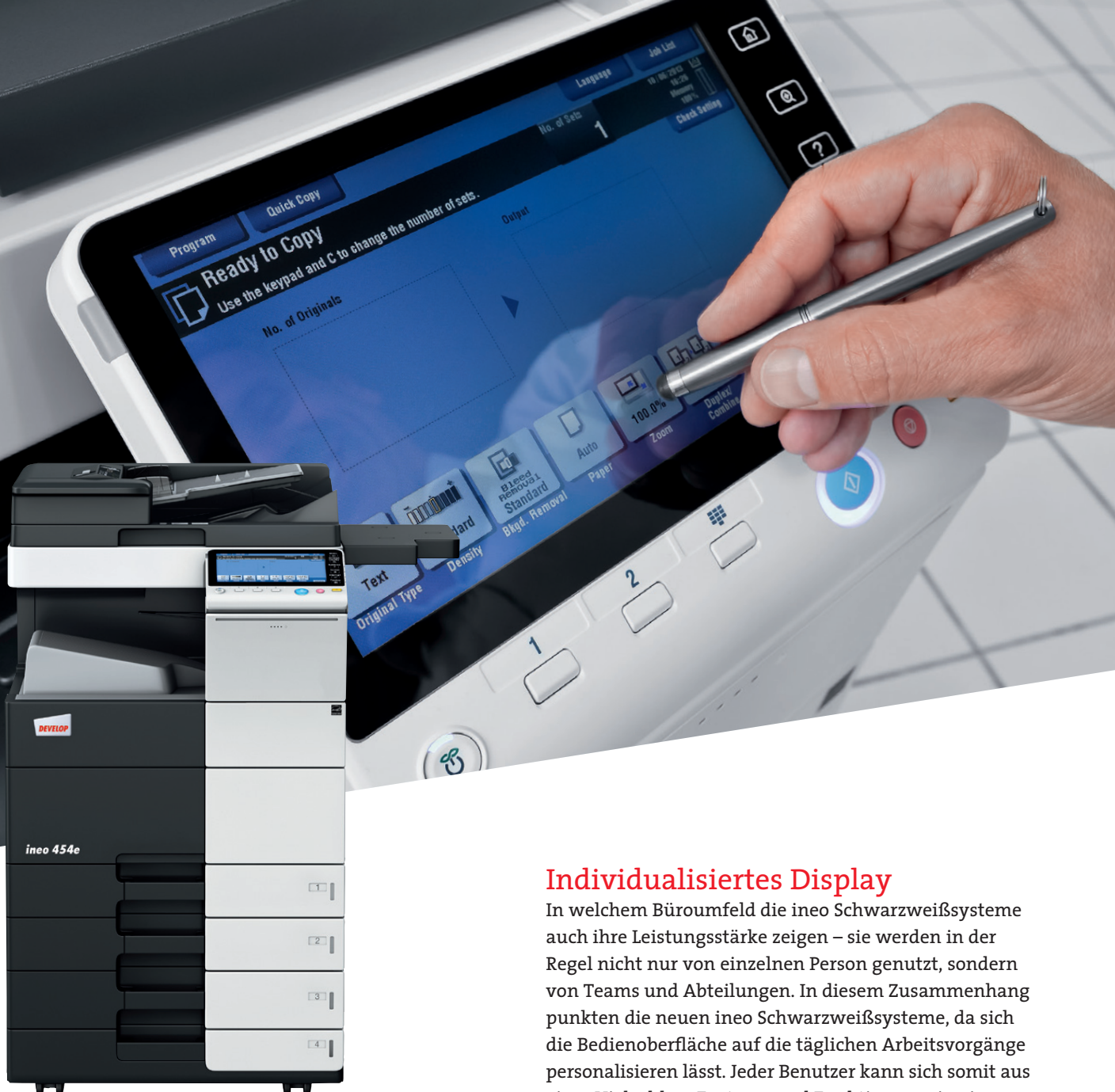
ineo 454e mit Papierkassette (PC-210), Ablagetisch (WT-506) und Ausgabefach (OT-506)