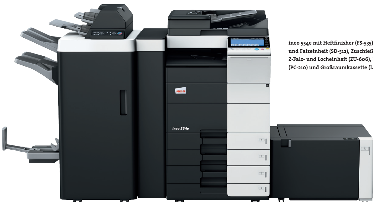
ineo 554e mit Heftfinisher (FS-535), Heft- und Falzeinheit (SD-512), Zuschießeinheit (PI-505), Z-Falz- und Locheinheit (ZU-606), Papierkassette (PC-210) und Großraumkassette (LU-204)

Jedes dieser Multifunktionssysteme – ineo 224e, ineo 284e, ineo 364e, ineo 454e und ineo 554e – ist einfach zu bedienen und hat eine große Bandbreite zusätzlicher Funktionen, die die tägliche Arbeit im Büro entscheidend erleichtern. Wenn beim Drucken, Kopieren und Scannen Zeit gespart wird, bleibt mehr Zeit für die eigentlichen Kernaufgaben – und das steigert die Produktivität im Büro.