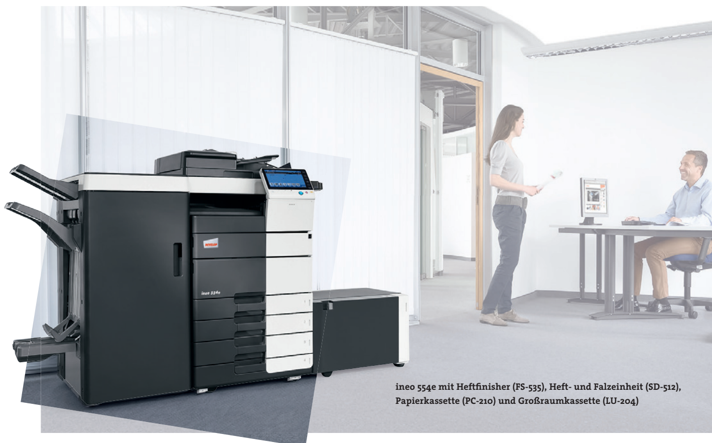
ineo 554e mit Heftfinisher (FS-535), Heft- und Falzeinheit (SD-512), Papierkassette (PC-210) und Großraumkassette (LU-204)

Zahlreiche Energiesparmaßnahmen sorgen bei den ineo Schwarzweißsystemen dafür, dass der Energieverbrauch um bis zu 40 Prozent unter denen der Vorgängermodelle liegt. Das spart zum einen Geld, hilft aber auch der Umwelt. Die neue ineo e-Serie ist nicht nur gut für das Unternehmen, sondern verbessert auch dessen ökologischen Fußabdruck.