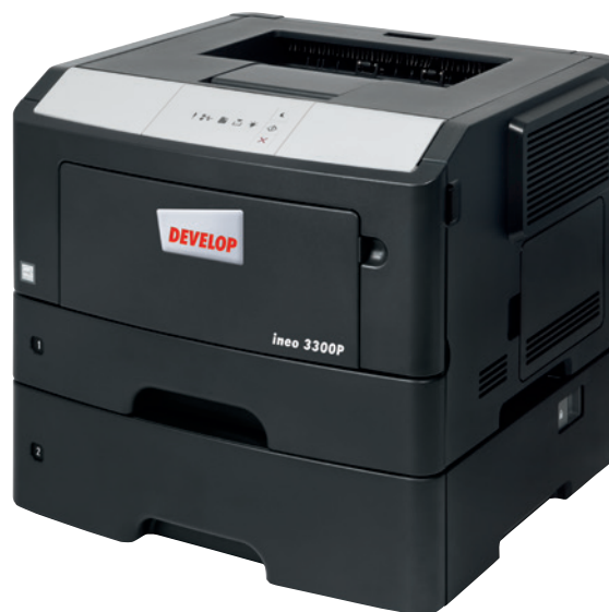
ineo 3300P mit zusätzlicher 550 Blatt-Papierkassette (PF-P12)

Ist Ihr derzeitiges Drucksystem unübersichtlich und schwer zu bedienen? Dann steigen Sie um auf die ineo 3300P. Der Bedienkomfort wird Sie und Ihr Team sofort positiv beeindrucken und es bleibt mehr Zeit für die wichtigen Kernaufgaben. Und bei der ineo 3300P brauchen Sie kein umfangreiches Bedienungshandbuch zu fürchten: sie lässt sich intuitiv bedienen.