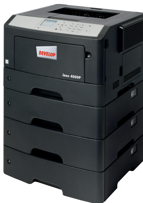
ineo 4000P mit drei zusätzlichen Papierkassetten (PF-P12)

Ist Ihr derzeitiges Drucksystem unübersichtlich und schwer zu bedienen? Dann steigen Sie um auf die ineo 4000P. Das 2,4-Zoll Farbdisplay ist intuitiv zu bedienen und hervorgehobene Menüs zeigen dem Benutzer den Systemstatus sowie Bedienungsoptionen und -einstellungen. Mehr noch – die Navigation über Ordnerstrukturen ist übersichtlich und erleichtert Ihnen die Bedienung. Der Bedienkomfort wird Sie und Ihr Team sofort positiv beeindrucken und es bleibt mehr Zeit für die wichtigen Kernaufgaben. Und bei der ineo 4000P brauchen Sie kein umfangreiches Bedienungshandbuch zu fürchten: sie lässt sich intuitiv bedienen.