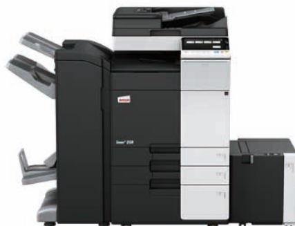
ineo+ 258 mit Dual Scan Originaleinzug (DF-704), Heftfinisher mit Broschüreneinheit (FS-534SD), Großraumpapiermagazin (LU-302) und Papiereinzug (PC-410)