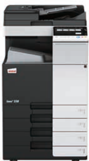
ineo+ 258 mit Dual Scan Originaleinzug (DF-704), Ausgabefach (OT-506) und Papiereinzug (PC-210)

Wenn Sie in eine ineo+ 258 investieren, sind Sie in Bezug auf Spezialaufgaben, wie z. B. auf hochwertigem Karton gedruckte Einladungen, nicht mehr von externen Dienstleistern abhängig. Dadurch sparen Sie Zeit und Geld. Mit der ineo+ 258 können Umschläge, Recyclingpapier, vorbedrucktes Papier, OHP-Folien, viele andere Medien und selbst Karton bis zu einem Papiergewicht von 300 g/m 2 bearbeitet werden. Diese Systeme können zahlreiche Papierformate, von A6 bis A3+ (SRA3), sowie benutzerdefinierte Formate und Banner bis zu einer Länge von 1,2 Metern bedrucken. Außerdem ermöglichen die vielfältigen Endbearbeitungsoptionen das Erstellen bis zu 80-seitiger Broschüren, verschiedene Arten des Brieffaltens, das Heften von Handouts oder Lochen von Rechnungen. Mit einer ineo+ 258 kann fast jeder Druckauftrag intern bearbeitet werden.