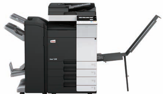
ineo+ 258 mit Dual Scan Originaleinzug (DF-704), Heftfinisher mit Broschüreneinheit (FS-534SD), Bannereinzug (BT-C1e) und Papiereinzug (PC-210)