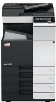
ineo+ 308 mit Dual Scan Original-einzug (DF-704), Ausgabefach (OT-506) und Papiereinzug (PC-210)

Wenn Sie in eine ineo+ 308 investieren, sind Sie in Bezug auf Spezialaufgaben, wie z. B. auf hochwertigem Karton gedruckte Einladungen, nicht mehr von externen Dienstleistern abhängig. Dadurch sparen Sie Zeit und Geld. Mit der ineo+ 308 können Umschläge, Recyclingpapier, vorbedrucktes Papier, OHP-Folien, viele andere Medien und selbst Karton bis zu einem Papiergewicht von 300 g/m 2 bearbeitet werden. Diese Systeme können zahlreiche Papierformate, von A6 bis A3+ (SRA3), sowie benutzerdefinierte Formate und Banner bis zu einer Länge von 1,2 Metern bedrucken. Außerdem ermöglichen die vielfältigen Endbearbeitungsoptionen das Erstellen bis zu 80-seitiger Broschüren, verschiedene Arten des Brieffaltens, das Heften von Handouts oder Lochen von Rechnungen. Mit einer ineo+ 308 kann fast jeder Druckauftrag intern bearbeitet werden.